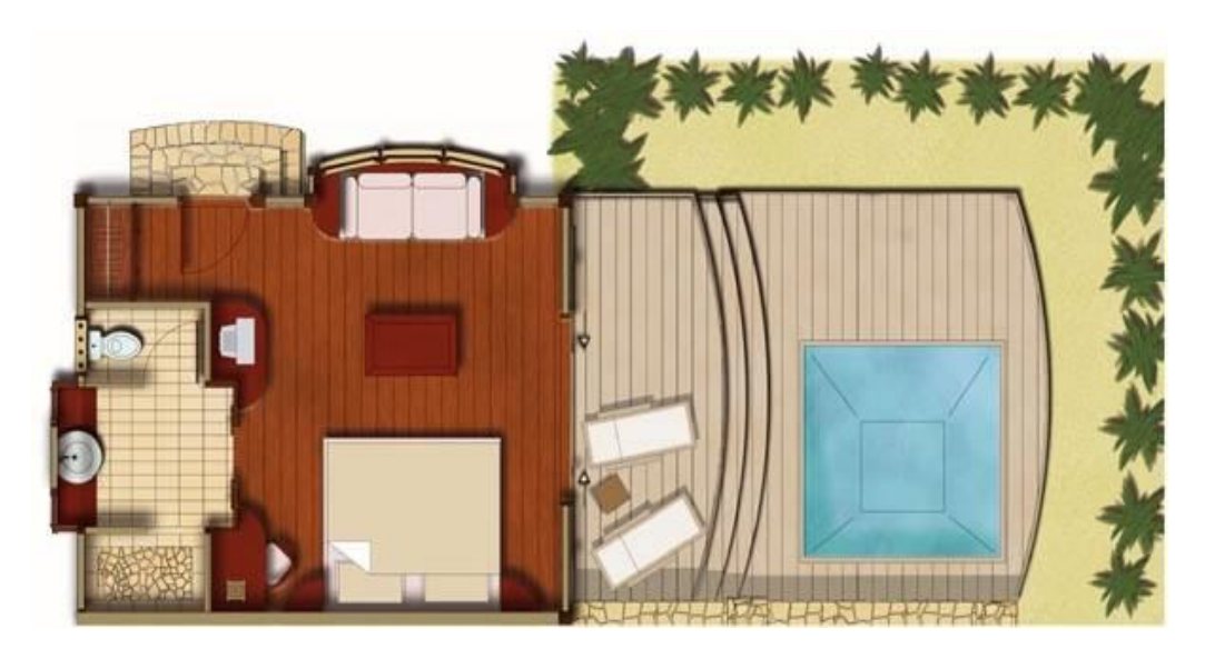
Premium Garden Pool Bungalow: 517 sq foot / プレミアムガーデンプールバンガロー: 48 m<sup>2</sup>