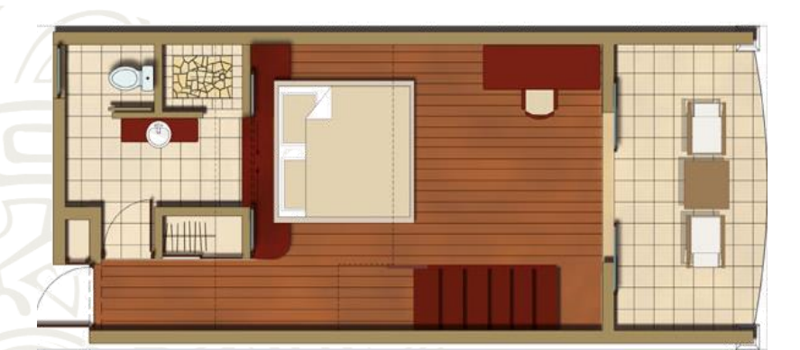
Family Garden Duplex: 635 sq foot / ファミリーガーデンドゥプレクス : 59 m