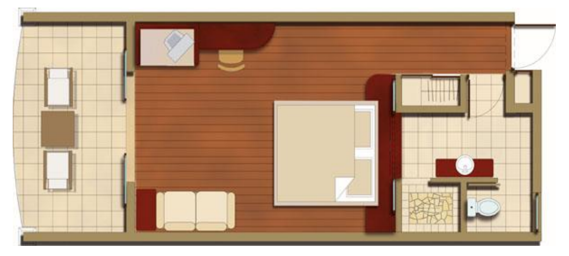
Garden View: 475 sq foot / ガーデンビュールーム : 44 m<sup>2</sup>