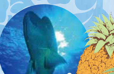
Illustration of a pineapple and a white flower.

ペンション・ヴァイアマ・ヴィラージュ 大きな食堂が印象的なペンション。 全室ビーチバンガロー、公共スペースにコーヒー、 紅茶完備。